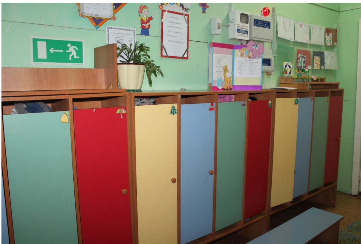
1. Информационный стенд для родителей «Для Вас родители»: